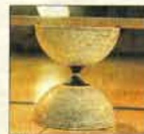
Valmistu. Timmalasin muotoisen diabolon ja kepit odottavat esityksen alkamista.

■ Internet avasi uudenlaisen väylän harrastukseen laajalti 2000-luvulla. Esimerkiksi